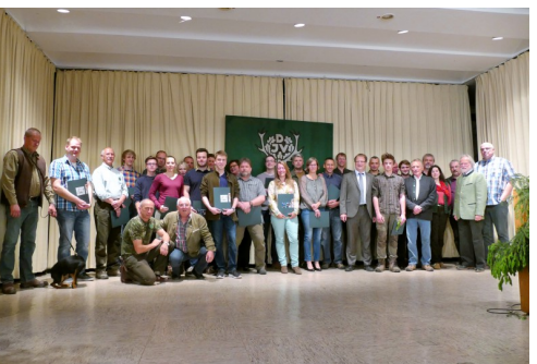
Übergabe der Briefe an die Jungjäger